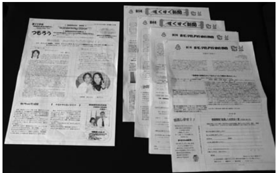
社内報「つもうろ」ここですべてのクレームが公表されている

例えば「ヒヤリハット事例集」「ハットしてGOOD事例集」にまとめて教育をする。そして、いつどんなクレームが発生したか、それに対してどんな手を打ったかはすべて社内報に掲載し、社員だけでなくお客さまにも配っている。