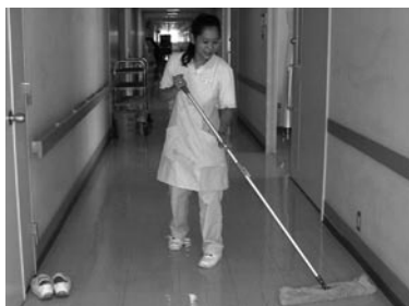
クリーニングを担当するクリーンキーパー業務