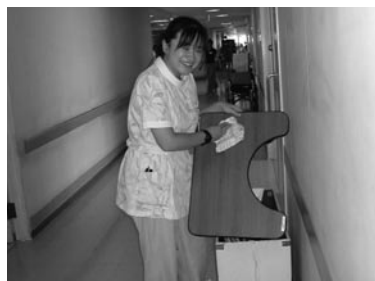
病院の看護師を補助する病棟アテンダント業務

技術・技能教育に力を入れた。だがやがて、お客さまは技術のよしあしでビルメンテナンス会社を選んでいるのではない。むしろ社員の応対、社員の質、それらを含めた会社の経営力によって会社を選んでいるのだと思うようになった。