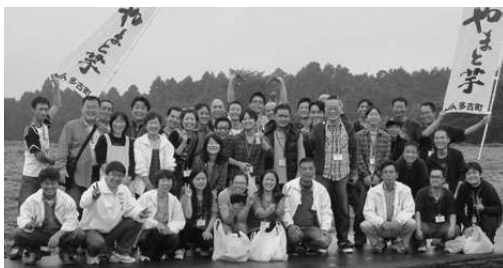
毎年、社員40~50人が参加する 千葉県多古町のやまと芋収穫祭