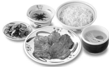
牛たん とろろ 麦めし