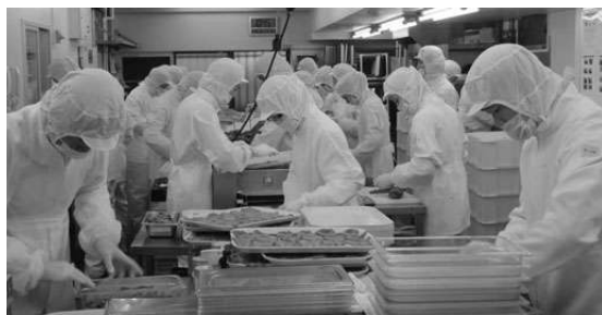
セントラルキッチン

こうした従業員の一致協力と最大限の働きを引き出す仕組みを、同社では「人材共育」と呼んでいる。「お客さまにおいしさを」の実践のためにも仕組みがある。サポートオフィスの1階はセントラルキッチンになっていて、ここには60人の手切り・手振り塩の集団が集結している。肉を包丁で手切りし、塩コショウを手振りするのだ。機械ではなく、肉の筋にそって人の手で表面に細かい切れ目を入れることで、塩コショウが浸透し、炭火で焼いたときに余分な脂が抜ける。それが肉の旨みを引き出す。