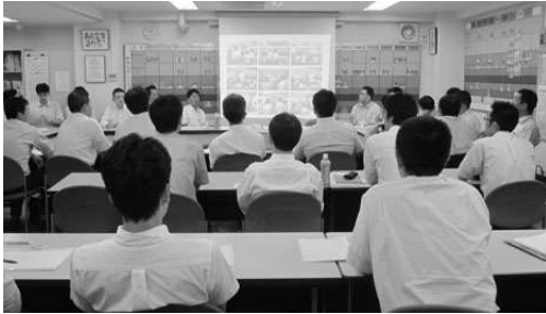
店長SOプロジェクト

る。先にも触れた「ビューティフルカンパニー宣言」「日本のとろろ文化に貢献する」「おいしい味づくりで楽しい街づくり」の3つだ。