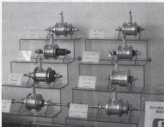
さまざまなエアハブ