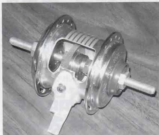
エアハブの内部機構

で削っていく総削り製法は時間がかかり、材料の無駄も多い。そこで、フランジと胴の部分に分け、それぞれ鉄の丸棒を真っ赤に熱してプレスにかけて形を整える熱間鍛造に変えた。熱間鍛造の次には冷間鍛造による製法が登場した。常温でプレスすることで熱間よりも精度が出やすく、焼いていないから表面がきれいに仕上がる。しかし、会社には冷間鍛造用の大きな精度の高いプレス機を導入するだけの資力はなく、そこでさらに一步先を読んで部品をさらに細分しそれぞれを鉄板の絞り加工によってつくる製法を編み出した。中が空洞だから重量も軽くなり材料の使用量も少なくなっただけで大きなコストダウン効果が得られた。