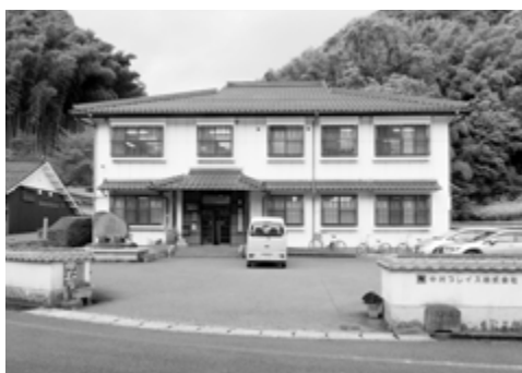
中村ブレイス本社

ている。義肢（義足，義手）が患者1人ひとりに合わせて受注生産されるのに対して，装具の多くは規格品での対応が可能で，同社は，シリコン樹脂製の足底板を皮切りに，各種規格化した装具の製造販売をはじめた。