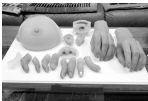
人工乳房と人工の手指, 鼻, 耳

透明のシリコンの裏側から筆で着色した。残った乳房の写真を撮り、どこまでもその色に近づける。透いて見える血管まで描いた。そこまでして、ようやく患者から、喜びの声と心からの感謝の便りが寄せられるようになった。やがて、同じ方法で、事故や病気で手指、鼻、耳を失った人のための「スキルナー」もつくられるようになった。